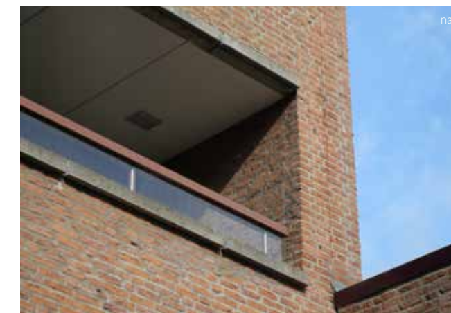
Situatie voor, tijdens en na Residentie de Burghave in Heemstede