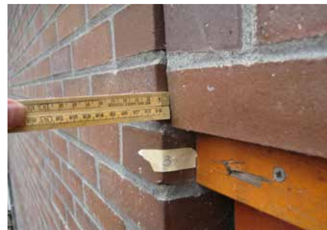
Inspecties en herstelwerkzaamheden De Dukaat in Amsterdam

Schade aan gevels is een actueel thema. Zowel door de toename van de schadegevallen - door onder meer aardbevingen in Groningen - als door de aandacht die de Inspectie Leefomgeving en Transport (de oude VROM-inspectie) hieraan geeft. Vallende stenen of gevelelementen komen helaas met enige regelmaat in het nieuws. De gevel heeft niet het eeuwige leven, ondanks dat vele gebouweigenaren hier wel vanuit gaan. De Inspectie Leefomgeving en Transport heeft in 2010 gebouweigenaren met een evaluatierapport en een schrijven gewezen op hun verantwoordelijkheid. Zij sommeert inspecties uit te voeren bij gebouwen hoger dan vier bouwlagen en ouder dan 25 jaar. Ondanks een ontwerplevensduur van 50 jaar zijn veel gevels, en met name de spouwankers, al na 25 jaar aan het eind van hun technische levensduur.